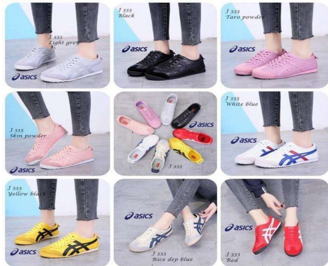
Gambar 3. 4. Produk Sepatu Wanita