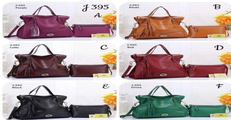
Gambar 3. 2. Produk Tas