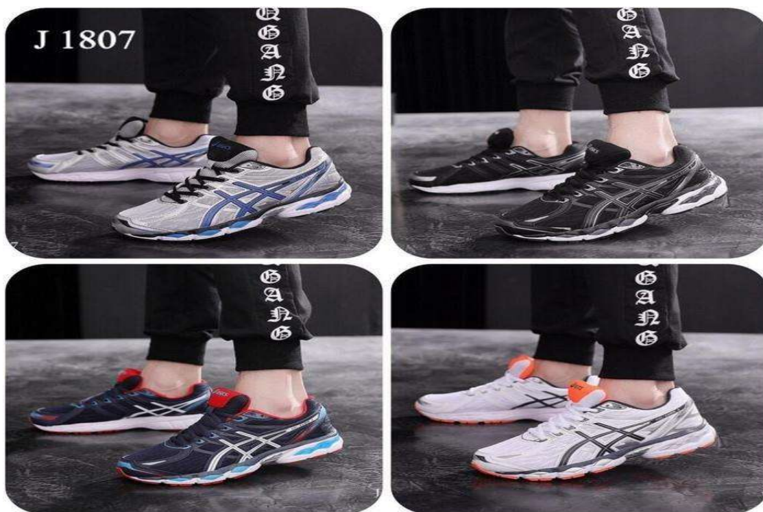
Gambar 3. 3. Produk Sepatu Pria