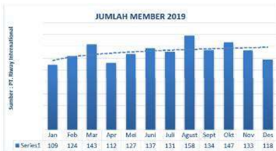
Gambar 1.1 Jumlah Member

Demikian grafik data member riway dari cabang perusahaan PT. Riway International di Kota Batam, sebagai berikut.