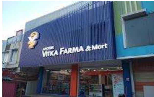
Gambar 3. 2 Tempat penelitian