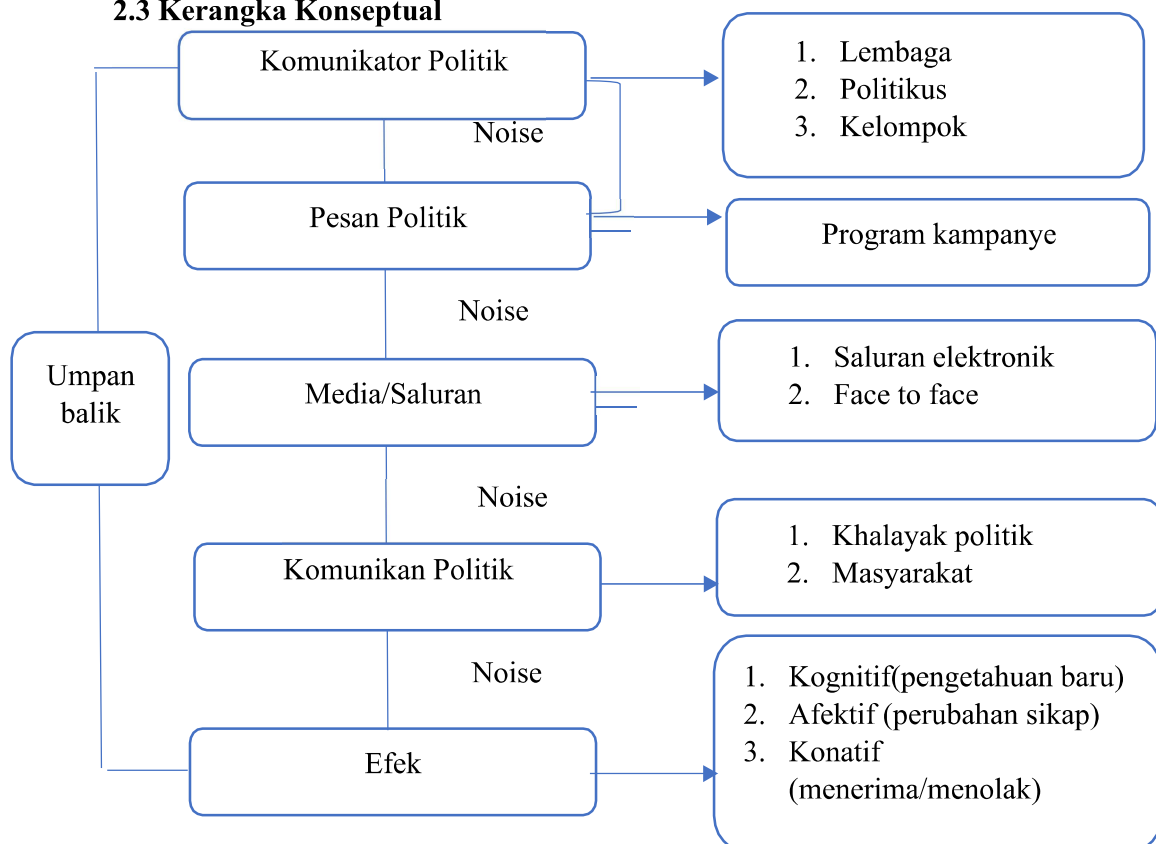
Tabel 2.3 Kerangka Konseptual