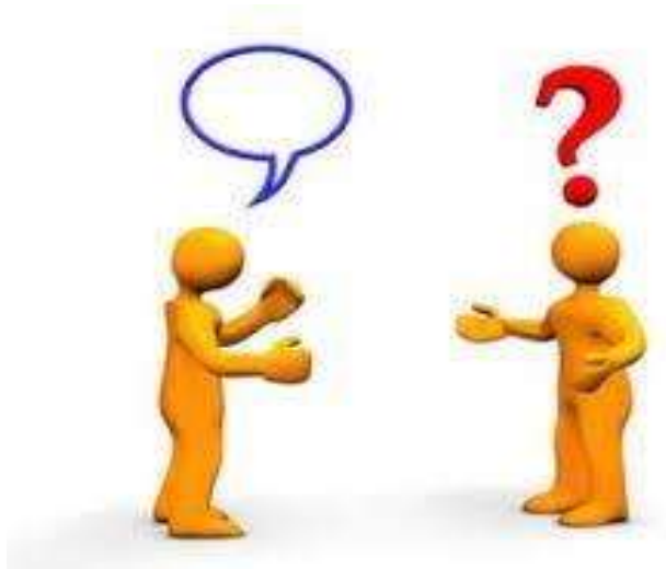
Gambar 2.1 Hambatan Komunikasi