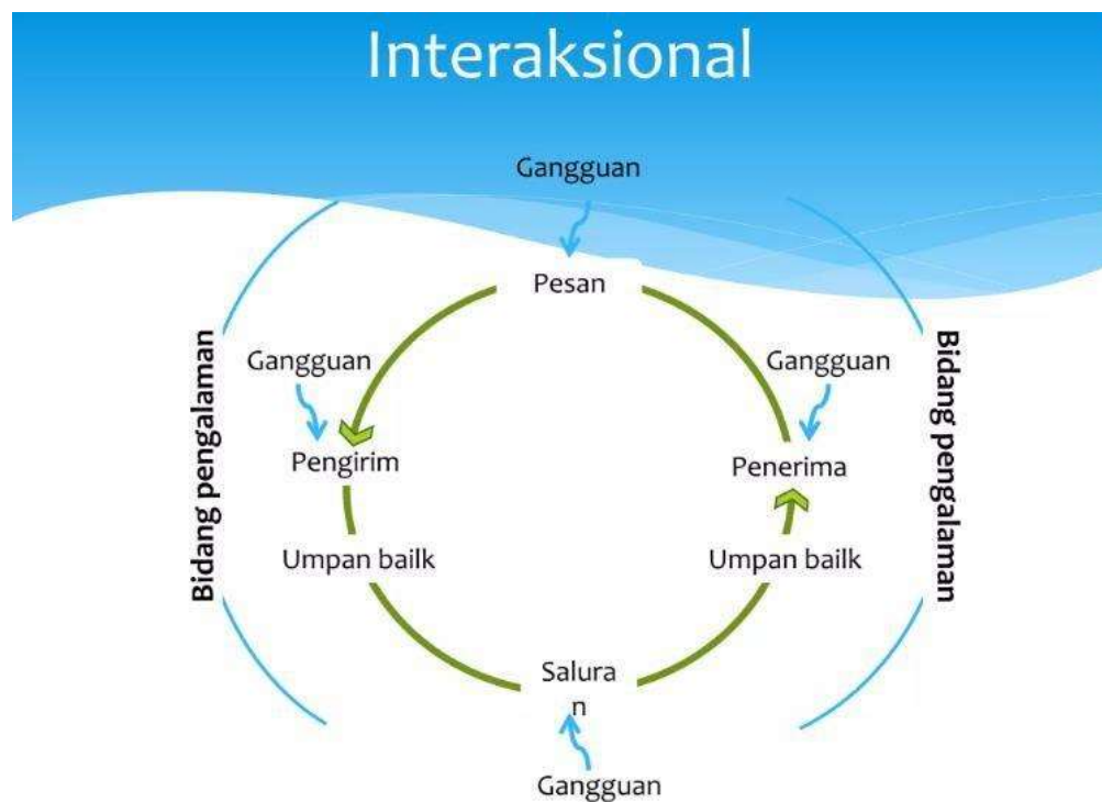
Gambar 2.1 Pola Komunikasi Interaksional

Riadi & Hidayat ( 2022) Fokus model ini adalah pada kemampuan berbicara atau berbicara, yang biasanya tentang kekuatan persuasif pembicara, yang tercermin dalam isi pidato, organisasi pidato dan cara penyajiannya. Pencapaian ketiga hal tersebut dapat mengukur kemampuan persuasif seseorang. Model komunikasi ini terus berkembang, namun akan selalu ada tiga aspek yang selalu sama dari waktu ke waktu, yaitu: Pengirim pesan, pesan terkirim dan penerima pesan.