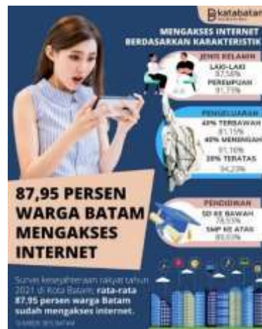
Gambar 1. 2 Survei Kesejahteraan Rakyat tahun 2021 di Kota Batam

Dalam hal ini, pengguna media sosial harus cermat untuk mengelola pikiran, tindakan dan perasaan dalam bermedia sosial. Pengguna media sosial harus lebih selektif dalam menyampaikan informasi. Media sosial saat ini banyak sekali, salah satu media sosial yang banyak diminatti pada tahun ini adalah Instagram. Menurut data dari statista pada periode januari 2022, pengguna aktif Instagram di Indonesia berjumlah 99,1 juta orang (Statista, 2022. Diakses pada 8 maret 2023).