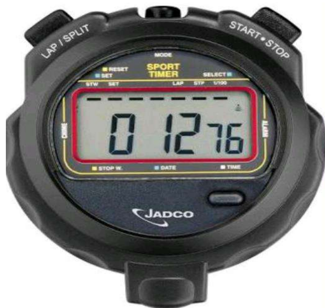
Gambar 3.3 Stopwatch

Stopwatch ini digunakan dalam penelitian ini agar peneliti dapat menentukan berapa lama waktu yang dibutuhkan untuk setiap periode pengambilan data intensitas cahaya.