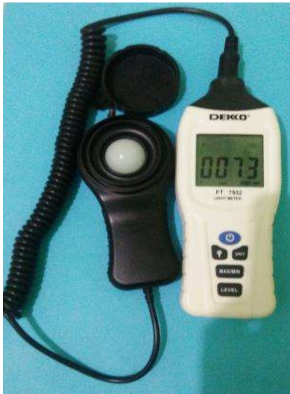
Gambar 3.2 Lux meter

Lux meter ini digunakan dalam penelitian ini agar peneliti dapat menentukan berapa besar intensitas cahaya yang di hasilkan pada redesign lampu LED.