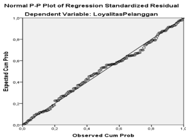
Gambar 2. Uji Normalitas dengan Normal P-P Plot

Berdasarkan gambar di atas, dapat dilihat bahwa kurva yang dihasilkan adalah bentuk lonceng ( bell-shaped curve ). Maka dapat disimpulkan bahwa data sudah berdistribusi normal. Cara kedua untuk uji normalitas adalah dengan melihat diagram Normal P-P Plot Regression Standardzed . Hasil dengan menggunakan diagram Normal P-P Plot Regression Standardzed adalah sebagai berikut :