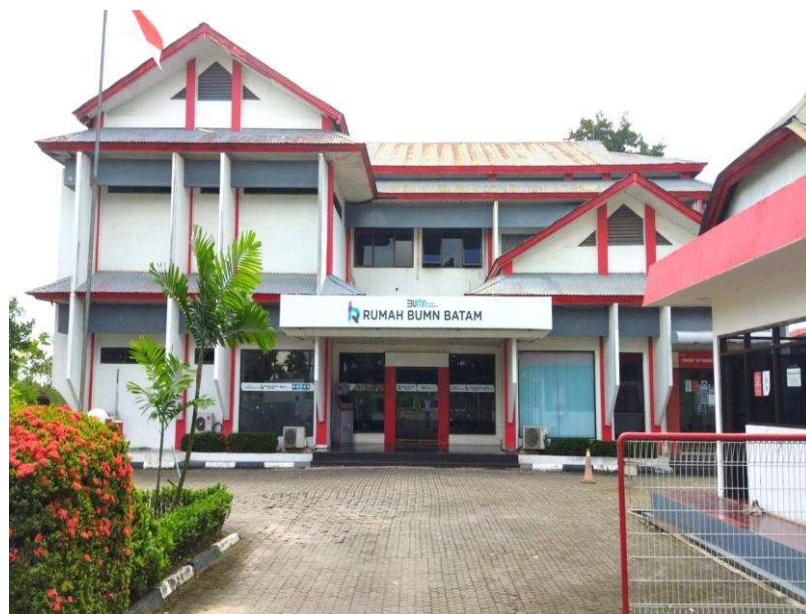
Gambar 3. 2 Lokasi Penelitian

Rumah BUMN Batam menjadi lokasi penelitian yang berada di Jl. Letjen R. Suprpto, Sagulung Kota, Kec. Sagulung, dan memiliki jarak tempuh 12 menit dari Universitas Putera Batam Tembesi.