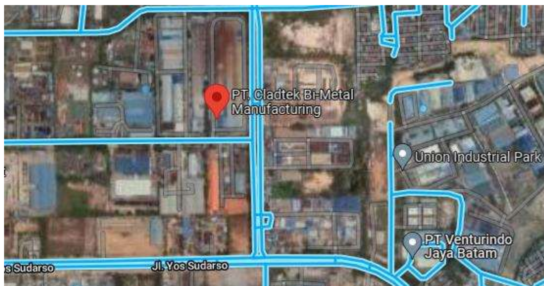
Gambar 3.2 Peta lokasi PT. Cladtek Bi-Metal Manufacturing Batam