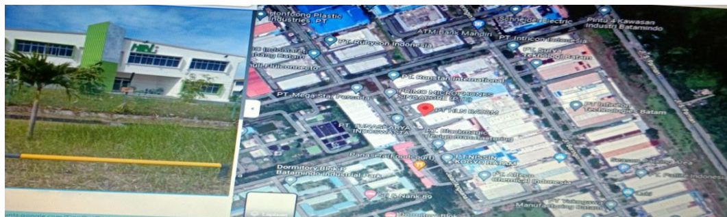
Gambar 3. 2 Lokasi Penelitian

Pada penelitian ini diadakan di PT HLN RUBBER Batam yang beralamat Jl.Angsana-Batamindo Industrial Park, Lot.279, Muka Kuning,Batam, Kepulauan Riau 29433.