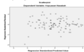
Gambar 3 uji Heteroskedastisitas

Uji heteroskedastisitas memiliki tujuan untuk menguji apakah dalam model regresi terjadi ketidaksamaan variance dari residual satu pengamatan ke pengamatan yang lain.