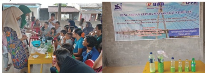
Gambar 1. Pembuatan Sabun Cuci Piring

Peserta dengan tekun menyimak cara membuat sabun cuci dan keset (Gambar 1 dan Gambar 2).