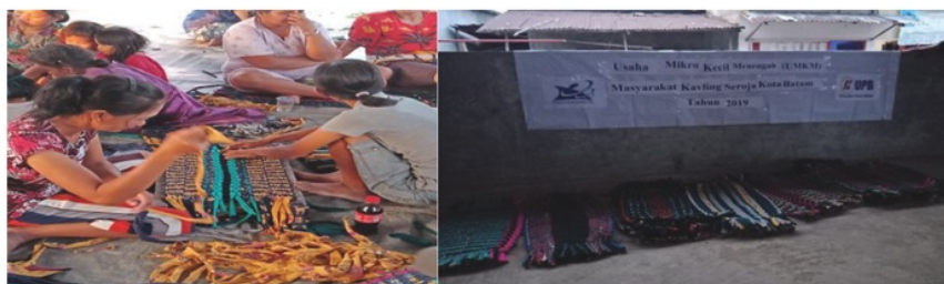
Gambar 2. Keset Kaki yang Dihasilkan