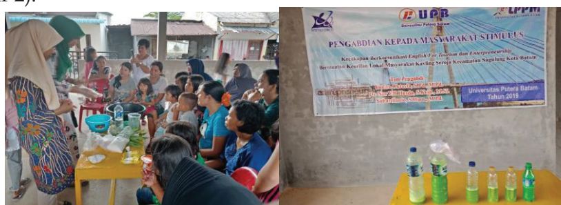
Gambar 1. Pembuatan Sabun Cuci Piring

Peserta dengan tekun menyimak cara membuat sabun cuci dan keset (Gambar 1 dan Gambar 2).