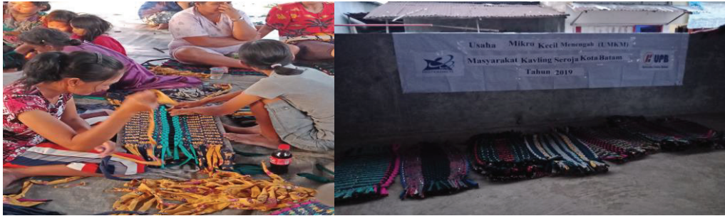
Gambar 2. Keset Kaki yang Dihasilkan