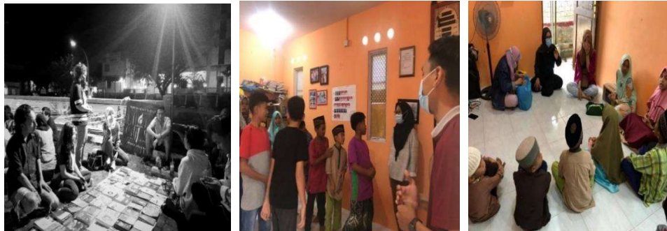
Gambar 1.2 Dokumentasi mengajar